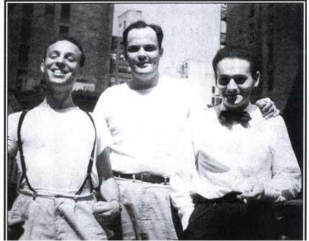
Harvey Kurtzman, John Severin et René Goscinny (1948)

Goscinny écrit " Le Petit Nicolas " pour Jean-Jacques Sempé dans Le Moustique et plus tard dans Sud Ouest, puis Pilote. Il est également scénariste et dessinateur du "Capitaine Bibobu", série parue en 1955.