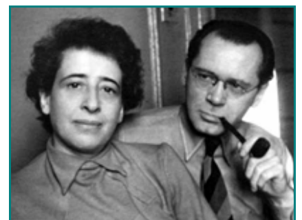
Hannah Arendt avec Einrich Blücher, son second mari.