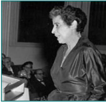
Hannah Arendt en Allemagne, 1955.

jugement. Elle interroge sans relâche la politique et son concept directeur, l'action, ainsi que son envers philosophique, la contemplation.