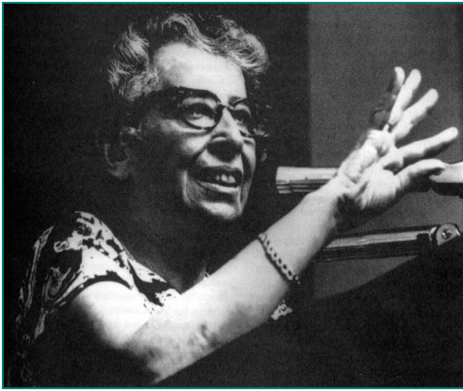
Hannah Arendt donnant une conférence