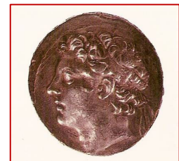
Pièce de monnaie à l'effigie d'Antiochos IV Epiphane, roi de 175 à 164 av. l'ère commune.

Antiochos IV à Jérusalem. Au cœur de Jérusalem, se dresse une forteresse, l'Akra, tenue par une garnison séleucide. Rebaptisée Antioche, Jérusalem devient une polis (cité) grecque. Tous les facteurs se combinent pour susciter une révolte.