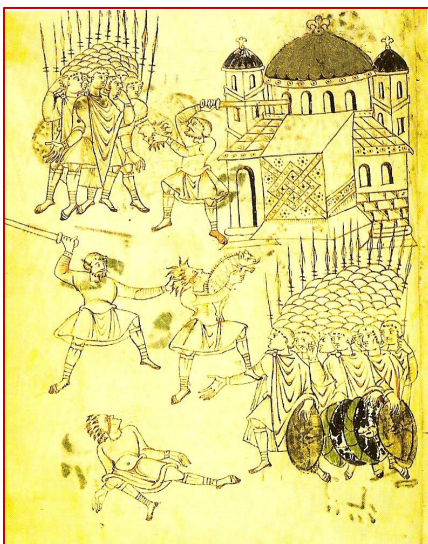
Le drame de la place du marché de Modi'in, vu par les moines de Saint-Gall, en Suisse. (Manuscrit du Livre des Maccabées, X ème siècle).

A Modi'in, Mattathias tue un juif qui s'apprêtait à sacrifier un porc sur un autel. Sur les paroles de "Celui qui est pour Dieu, qu'il vienne avec moi", Mattathias met en place une révolte. Accompagné de ses 5 fils et de juifs qui se rallient à sa cause, ils se cachent dans les montagnes pour se protéger des soldats d'Antiochos qui veulent venger l'incident de Modi'in. Ils sont bientôt 6000 juifs à combattre les séleucides.