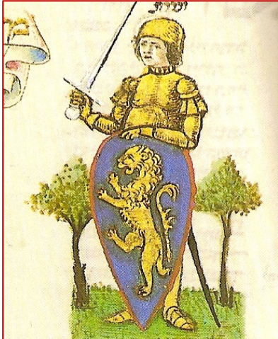
Judah Maccabée. Version hébraïque médiévale de la Guerre des Juifs de Flavius Josèphe. Italie du Nord (1450-1470).