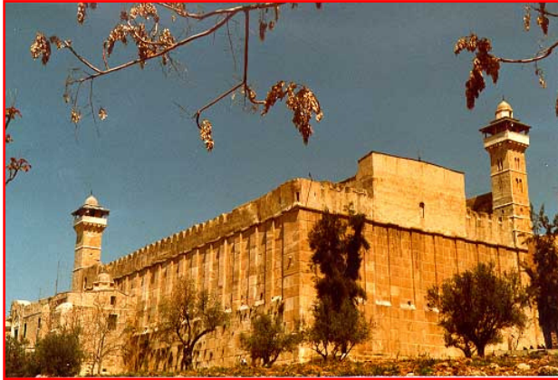
Le tombeau des patriarches dans la vieille ville d'Hébron