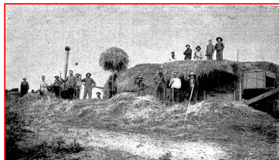
Colonie Moisesville – le battage.

En 1923, la production laitière a été de 7 145 000 litres. (...) Le petit lait est utilisé pour l'élevage de la volaille, qui se développe parallèlement (environ 77 têtes de volaille par colon).