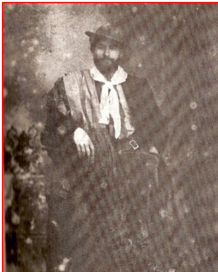
Colon juif quelques années après son installation en Argentine, dans la Pampa.