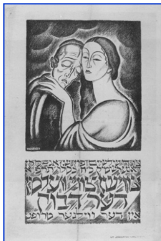
Affiche annonçant une représentation du Dibbuk, Varsovie, 1920