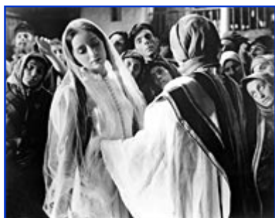
Scène du Dibbuk, film du polonais Michal Waszinski, 1937

Ce Roméo et Juliette de la littérature yiddish, probablement la pièce la plus célèbre du théâtre juif, comptera de nombreuses traductions et sera jouée partout dans le monde. Elle inspirera même un film homonyme, réalisé en 1937 par Michal Waszinski, qui deviendra le chef-d'œuvre du cinéma yiddish