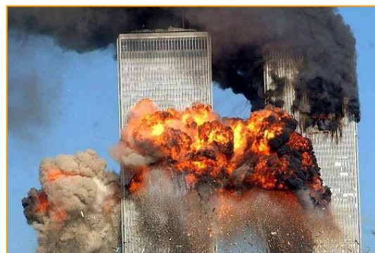
Attentat du World State Center, 11 septembre 2001

L'inspiration religieuse de cette organisation terroriste prend ses racines dans l'idéologie de Sayyid Qutb et de son livre Signes de piste écrit en 1968. Elle prône un islam sunnite radical et l'un de ses buts déclarés est de nuire aux intérêts américains partout dans le monde , pays qui s'est implanté en terre musulmane et ne cesse d'opprimer ses peuples. Al-Qaida est financée par des pays du Golfe mais aussi par de riches et pieux donateurs.