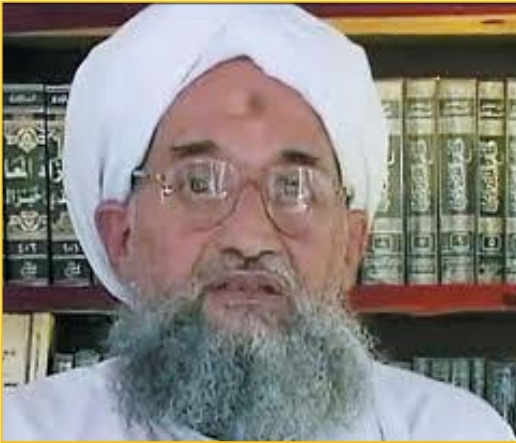
Ayman al-Zawahiri, nouveau leader

Dans son livre Guerre Sainte, multinationale , Peter Bergen ne cesse de comparer Al-Qaida à une entreprise multinationale, une véritable industrie du Jihad . Ben Laden y apportait les capitaux et le mouvement fonctionnait avec des filiales dans l'ensemble du monde, aux Etats-Unis, à Londres... Son chef prend toujours ses décisions après avoir vu son conseil ( choura ) et dispose de plusieurs comités spécialisés, notamment dans les médias.