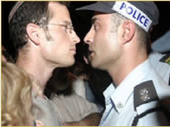
Face à face entre israéliens lors de l'évacuation.