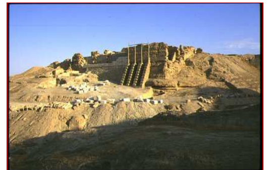
Restes du mur de soutènement de Doura-Europos