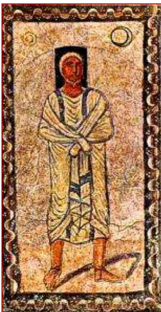
"La promesse" : détails de la fresque centrale de la synagogue