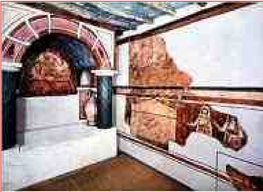
Le baptistère chrétien de Doura-Europos

Le site archéologique de Doura Europos (actuelle Salhieh) est situé à l'extrême sud-est de la Syrie sur le moyen Euphrate, à 35 kilomètres de la frontière irakienne.