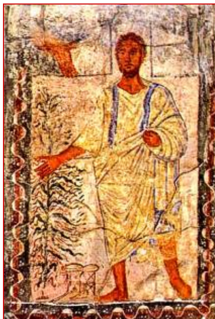
A Gauche : Moïse ou Abraham aux mains voilées