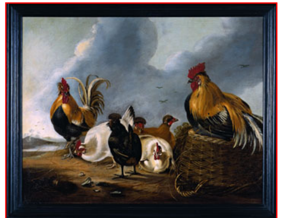
Coqs et poules, Cuyper Aelbrecht, Soissons, musée municipal.