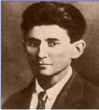
Franz Kafka (1883-1924)