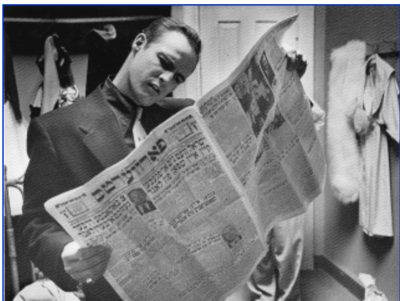
Marlon Brando lisant le Forward