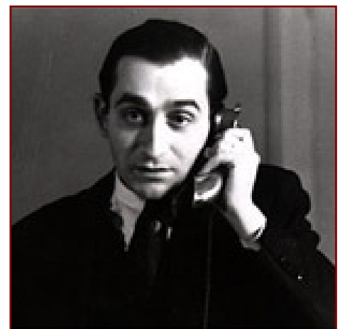
Pierre Mendès-France, en lien direct avec les citoyens...