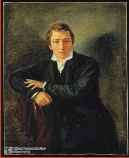
Portrait d'Heinrich Heine (1797-1856), par Moritz Oppenheim (1799-1882).