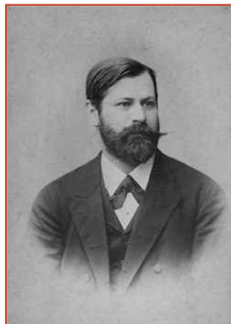
Sigmund Freud (1856-1939), inventeur de la psychanalyse.