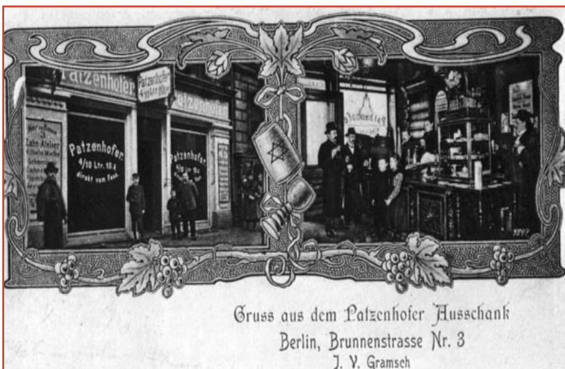
Carte postale publicitaire pour un débit de boissons juif dans la Brunnenstrasse.

Entre 1921 et 1927, on compte que près de la moitié des mariages sont mixtes .