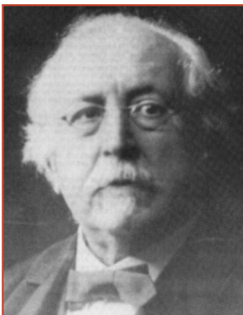
Hermann Cohen (1842-1918), philosophe, fondateur de l'école néo-kantienne de Marburg.

Tous les secteurs professionnels leurs sont désormais ouverts, exception faite du service publique . Exclut des fonctions académiques et des instances officielles et militaires, ils s'engagèrent, en grand nombre, dans les activités industrielles et économiques, ainsi que dans les professions libérales.