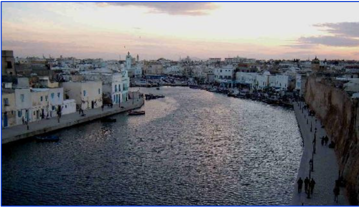
Vieux port de Bizerte, Tunisie