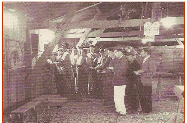
Shabbat dans le camp de Pithiviers

En mai 1940, avec l'attaque allemande, de nombreuses arrestations d'Allemands et d'Autrichiens eurent encore lieu. Ceux-ci furent envoyés dans les camps du Sud-Ouest, à Gurs en particulier. En octobre 1940, les Juifs du pays de Bade, en Allemagne, furent expulsés vers la zone Sud de la France. Ils furent internés par les Français au camp de Gurs. A partir de cette date, les libérations deviennent plus rares. Les internés juifs furent concentrés à Gurs. Les conditions de vie dans les camps se détériorèrent. Les rations alimentaires n'étaient pas suffisantes. Des centaines de personnes moururent de maladie et de faiblesse. Le gouvernement de Vichy créa de nouvelles catégories d'internés, et de nouveaux camps, comme celui de La Lande, dans l'Indre-et-Loire. Les Tsiganes français furent internés dans des camps, de même que des clochards.