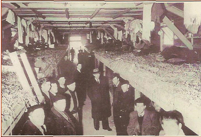
Premier jour dans les baraques à Pithiviers, © Serge Klarsfeld, Le Calendrier de la persécution des Juifs de France, Ed. FFDJF, 1993