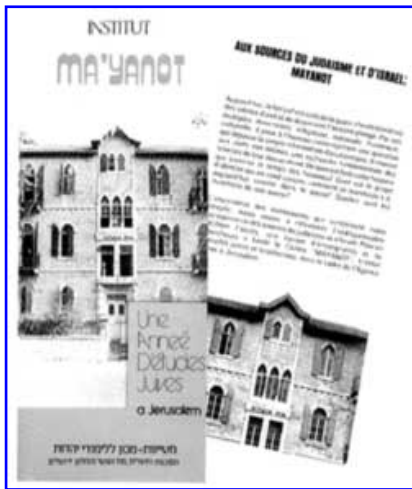
Brochure sur l'Institut Mayanot à Jérusalem