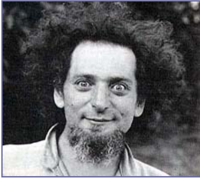
George Pérec (1936-1982)