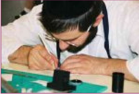
Le sofer, scribe de la Torah, méticuleux dans son travail.