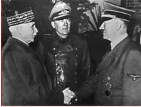
Le Maréchal Pétain et Adolph Hitler à Montoire le 24 octobre 1940