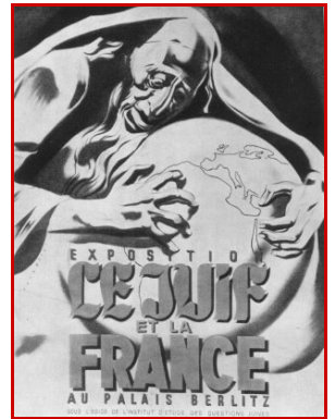
Affiche de l'Exposition Le Juif et la France

12 décembre : rafle de 700 notables Juifs à Paris.