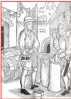
Les juifs de Sicile, expulsés en 1493