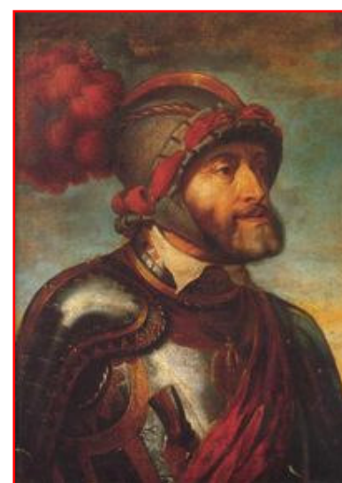
Charles Quint (1500-1558) est le petit-fils des Rois catholiques, Ferdinand et Isabelle de Castille.