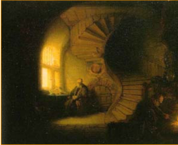
Rembrandt, Philosophe en méditation