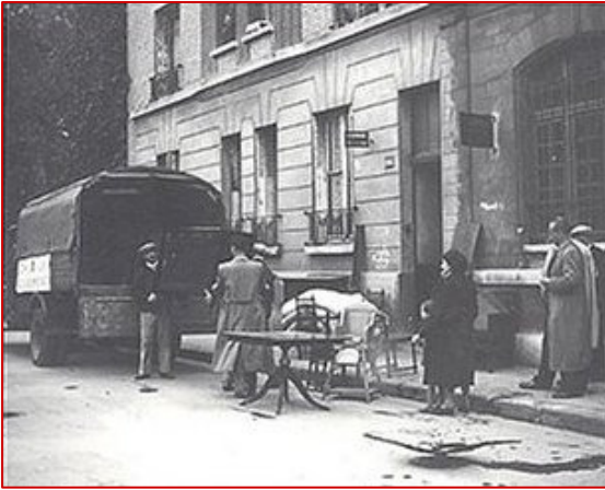
Scène de spoliation de biens juifs (tirée de Persécutions et spoliations des juifs pendant la seconde guerre mondiale , PUG, 2004).