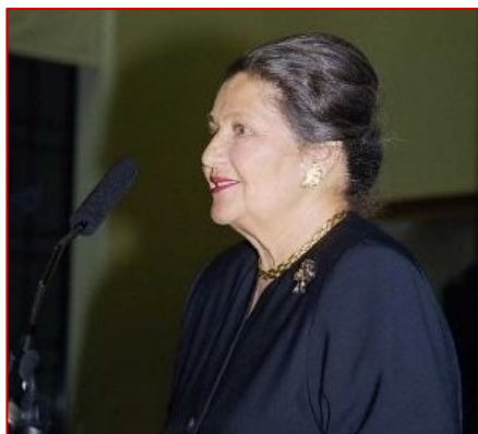
Simone Veil, Présidente de la FMS.